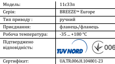
Таблиця 1. Характеристики