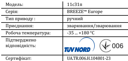
Таблиця 1. Характеристики